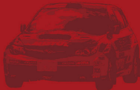
新井 敏弘 Toshihiro Arai

スバルのインプレッサSTiを操り、WRC / World Rally Championshipやインターコンチネンタル・ラリー・チャレンジなど、世界の代表的なラリー選手権シリーズで好成績を上げている日本人ラリードライバー、新井敏弘選手。2011年のインターコンチネンタル・ラリー・チャレンジでは、PRODUCTION CUP部門のシリーズ・チャンピオンを獲得。最新鋭のラリーマシンを走らせる新井選手も、実は、世界的なラリー選手権シリーズのエキシビションとして開催されるクラシックカー・ラリーの盛り上がりがおおいに気になっていたのである。もちろん、このことは日本でクラシックカーによるラリー・イベント開催を願う関係者にとっても幸運なことであった。早速、新井選手指揮のもと、世界レベルのクラシックカー・ラリーを日本で開催するための検討を開始。新井選手を支えてきたクラブ・チームの強力なサポートも得られることになった。